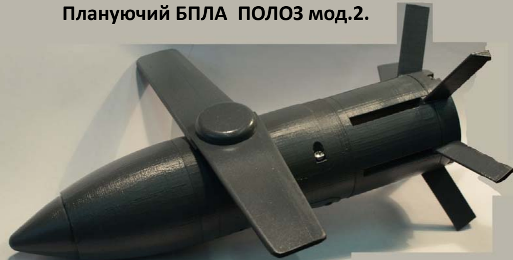
Плануючий БПЛА ПОЛОЗ мод.2.